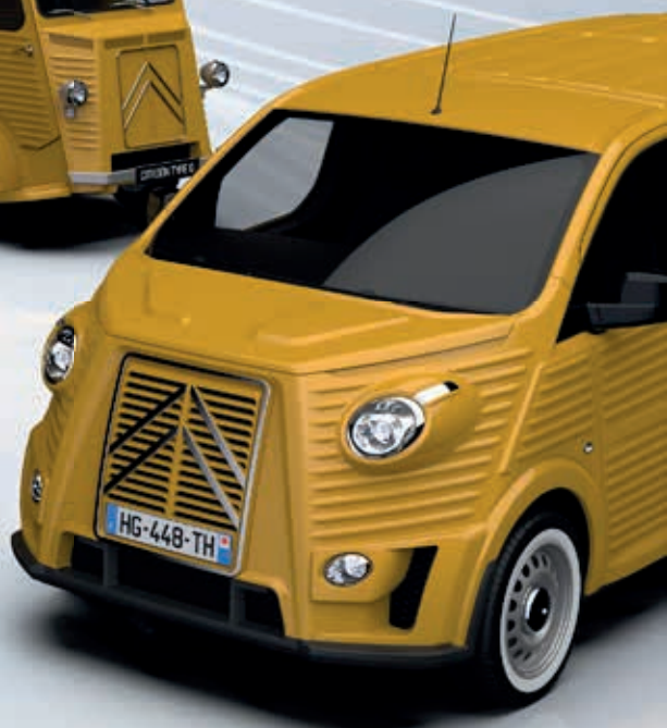
NEW TYPE HG