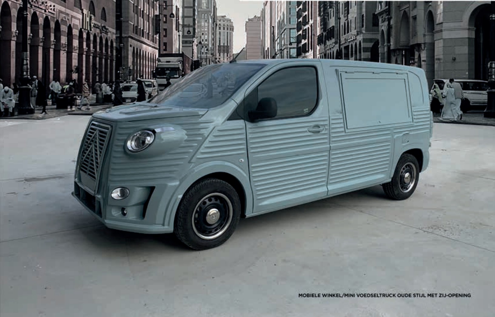
MOBIELE WINKEL/MINI VOEDSELTRUCK OUDE STIJL MET ZIJ-OPENING