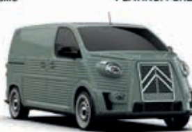
GIADA GREEN AC 539 - Pastel