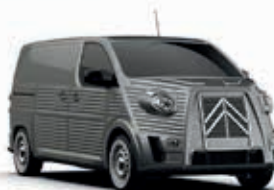
PLATINUM GREY - Metallic