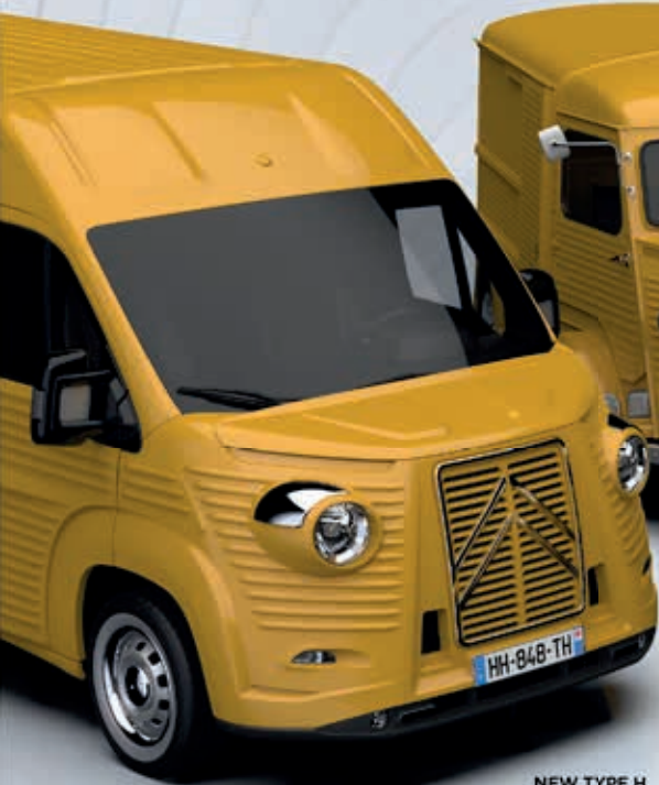
NEW TYPE H

Vandaag wordt onze Type H, met als basis de Citroën Jumper, vergezeld van een kleiner model, de Type HG, gebaseerd op de Citroën Jumpy/SpaceTourer, speciaal voor klanten die op zoek gaan naar een aangepast voertuig met oog voor detail.