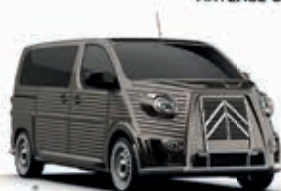
RICH OAK BROWN - Metallic