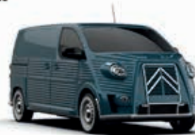
WEEK-END BLUE AC 625 - Pastel

* : Alleen met basisvoertuig van dezelfde kleur