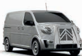
ARTENSE GREY - Metallic